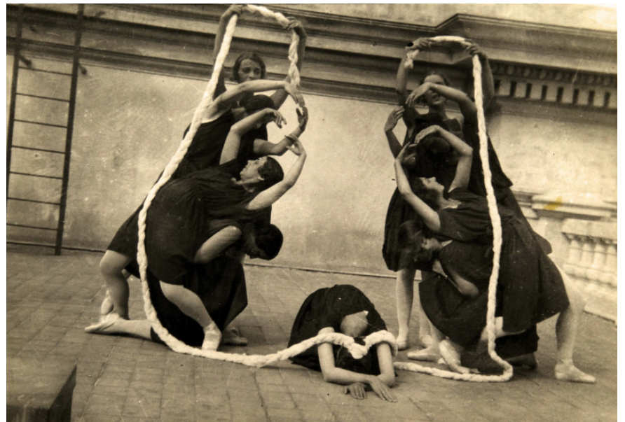
Photographie des répétitions des Noces sur le toit du Théâtre de Monte-Carlo en 1923