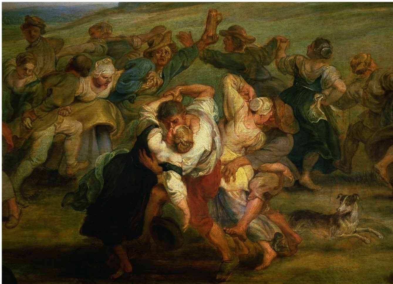
Troisième tableau « Kermesse ou noces au village » (détail) de Pierre Paul Rubens, 1635