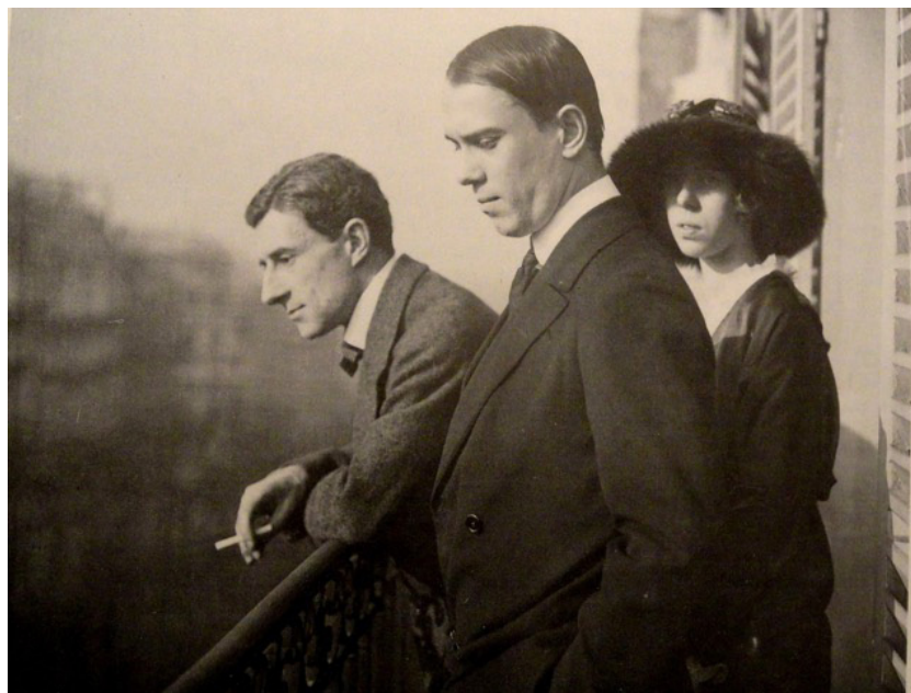
Maurice Ravel, Vaslav Nijinski et Bronislava Nijinska

Un Bolero , Musée de l'Orangerie, Danse dans les Nymphéas dans le cadre du Festival d'Automne à Paris