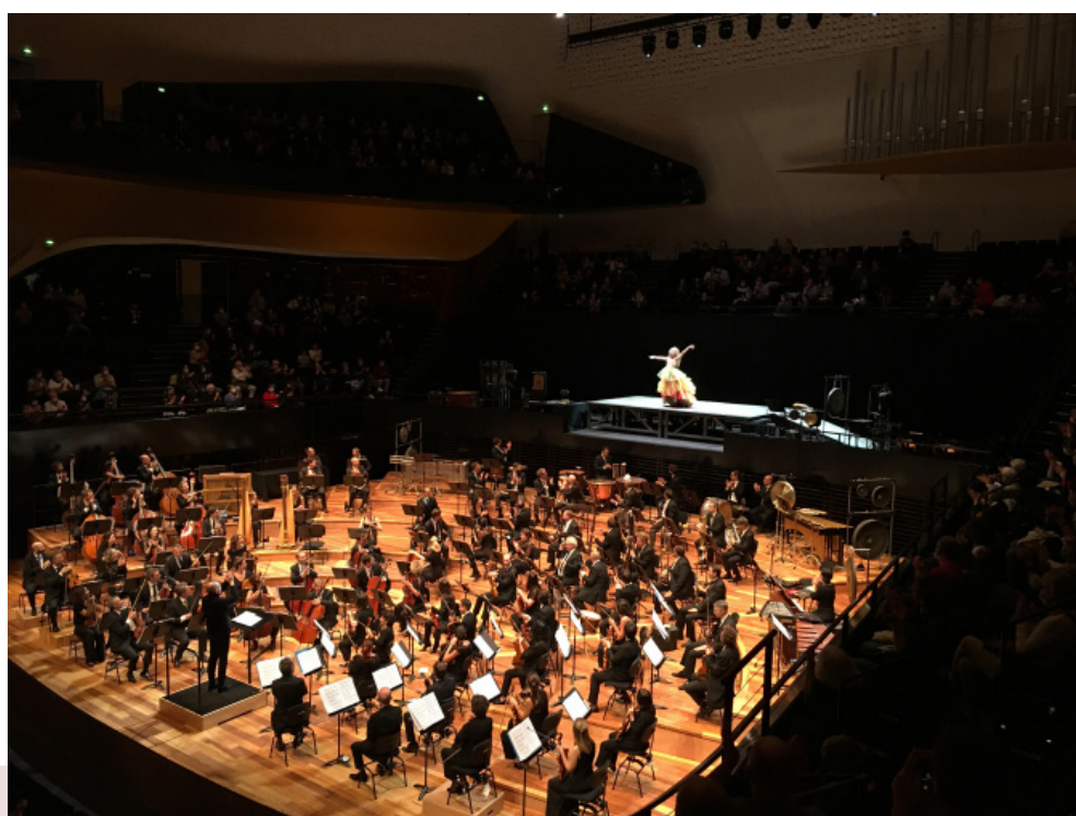
Création du solo Un Bolero interprété par François Chaignaud, version orchestrale avec l'Orchestre Les Siècles