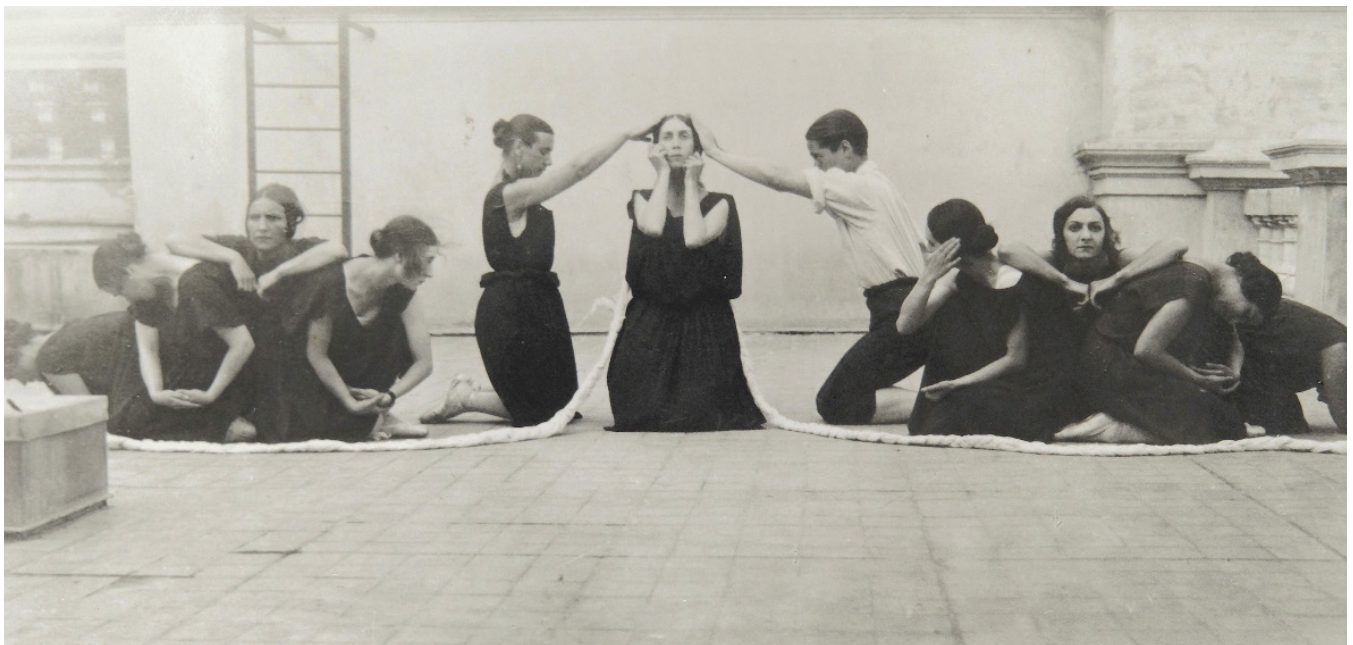
Photographie des répétitions des Noces sur le toit du Théâtre de Monte-Carlo en 1923

Par ailleurs, la dimension dramaturgique de l'œuvre de 1923 de Gontcharova-Nijinska-Stravinsky sera également interrogée. Les Noces de ces trois auteurs seront rapprochées de trois tableaux de l'histoire de l'art qui représentent le même sujet, à savoir, des noces paysannes. Il s'agit ainsi de « décrocher » la danse de Nijinska, de lui donner un autre cadre de lisibilité. Le devenir de cette œuvre se cherchera entre tradition et interprétation, entre traces écrites et inventions chorégraphiques.