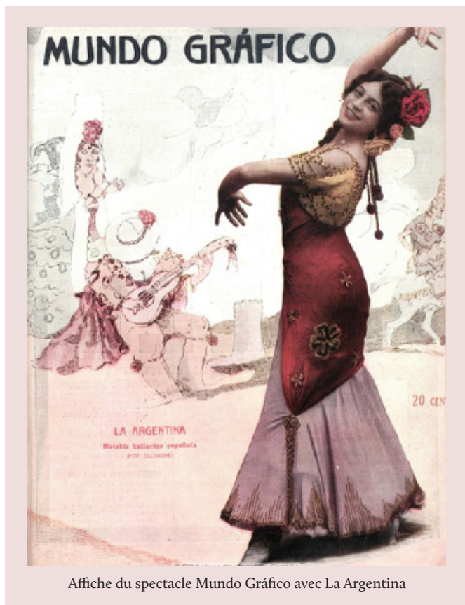
Affiche du spectacle Mundo Gráfico avec La Argentina

Le Bolero est pour ses quatre créateurs, une espagnolade. Une espagnolade qui aurait pu mal tourner pour Ravel. En effet, le projet de départ dans lequel il s'était engagé vis-à-vis de la commanditaire, était d'orchestrer Iberia d'Isaac Albéniz (1860-1909) ; or l'œuvre se trouvait protégée, et, croyant qu'il n'en obtiendrait pas les droits, il se ravisa et décida d'écrire son propre Bolero . Un an après, Iberia sera jouée à Paris, avec une interprète légendaire, au nom évocateur « La Argentina » (1890-1936). Ravel particulièrement, mais bien d'autres compositeurs aussi, se passionnèrent à cette époque pour l'Espagne, terre d'aventures musicales, notamment du flamenco. Pour Nijinska et les danseurs d'alors, l'aventure se proposait dans le tournoiement des jupes : celles des danseuses de flamenco, celles du french cancan, ou encore dans les soieries florales de Loïe Fuller. La danse de jupe – Skirt Dance – faisait recette. Toutes ces danses déroutaient, inspiraient, soufflaient un vent de modernité mais aussi de renouveau d'une certaine tradition.