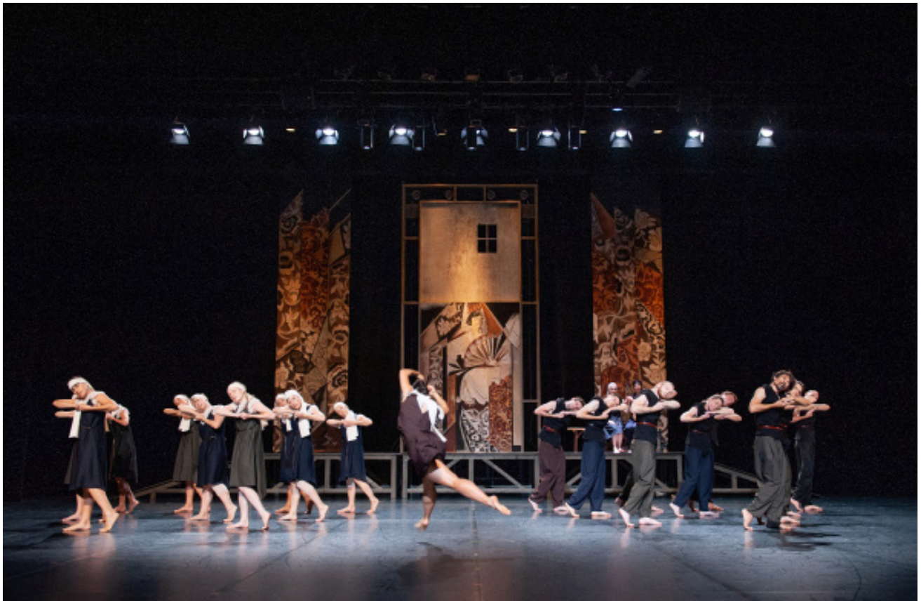
Les Noces © Laurent Paillier