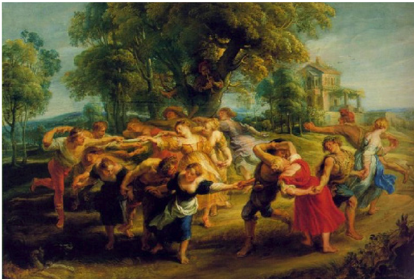
Deuxième tableau « Rondes paysannes » de Pierre Paul Rubens, entre 1633-37