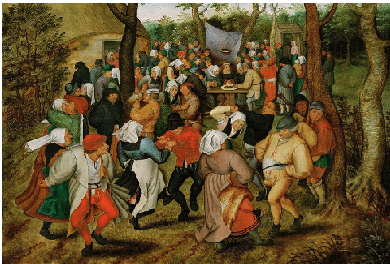
Premier tableau « Danses de noces en plein air » de Pieter Brueghel Le Jeune 1607

Ici, danseurs et musiciens prennent les attitudes de paysans dansants qu'on voit dans les compositions de nos deux peintres. Dans le premier tableau, les corps sont représentés « bassin en avant » dans des danses de couple, dans le deuxième, une « farandole érotique » serpente dans la nature. Le troisième tableau montre « deux couples qui s'enlacent ». J'imagine différemment ces étreintes explicitement sexuelles : je vois l'une consentie, l'autre forcée. Ce dernier tableau est là pour troubler cette opinion répandue selon laquelle le mariage est un événement heureux qui donne lieu à une sensualité consentie. Nous savons par ailleurs que le mariage peut aussi donner lieu à un forçage, autrement dit à un viol sur lequel la société ferme les yeux. L'immobilité relative de ces tableaux vivants – tout tremble et bouge – entre en tension avec la chorégraphie de Nijinska où les mouvements acérés se donnent comme de véritables coups et l'usage des pointes figure métaphoriquement le percement de l'hymen.