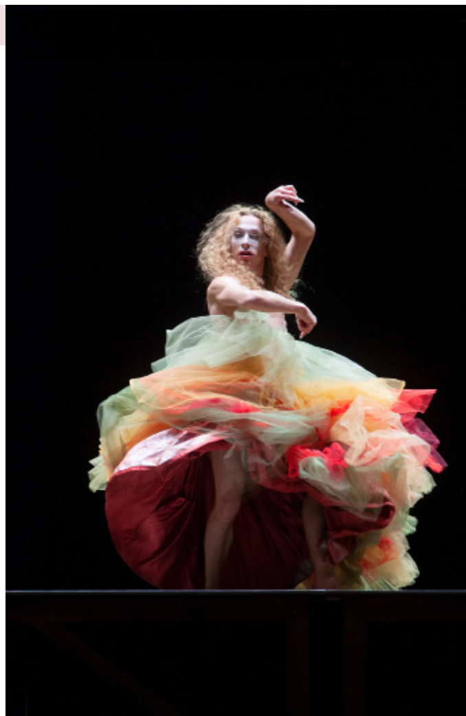
Un Bolero