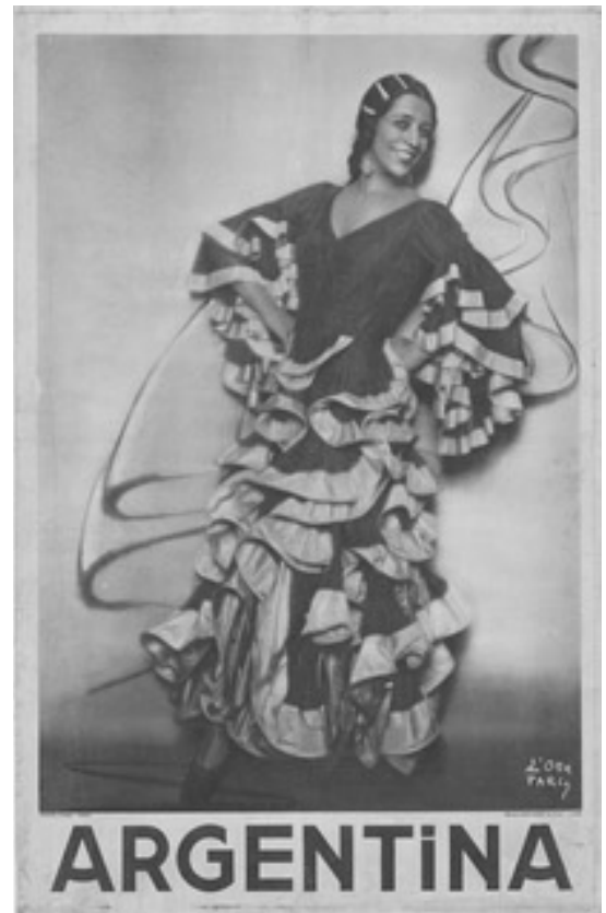
Affiche de La Argentina (Antonia Mercé y Luque)

Ces deux derniers imaginèrent ensemble un livret différent de celui envisagé par Ravel qui situait l'action dansée à la sortie d'une usine avec des hommes qui entraient progressivement dans la danse. Benois persuada notre musicien de suivre un autre scénario : « une taverne, une danseuse et des hommes en transe ». Le critique André Levinson (1887-1933) assista à la première représentation donnée à l'Opéra Garnier, le 22 novembre 1928. Il évoque ainsi l'argument du Bolero : « l'action dansée se passe sur une table massive, dans un cercle de lumière tombant d'une immense suspension, la danseuse, telle une somnambule, ne cesse pas un instant de reproduire le mouvement, constamment le même. Le décor du cabaret espagnol, discret, monochrome, ne sert qu'à répartir la clarté, à approfondir l'ombre ; lieu nu et sinistre, avec un peu d'Espagne autour. Le sujet est d'une simplicité extrême : vingt mâles fascinés par l'incantation charnelle d'une seule femme. [...] Par l'ondulation des bras et la torsion de la taille, [...] par le pied, aussi, qui trace des cercles à terre, la danseuse dessine le contour de la mélodie, brève formule magique » .