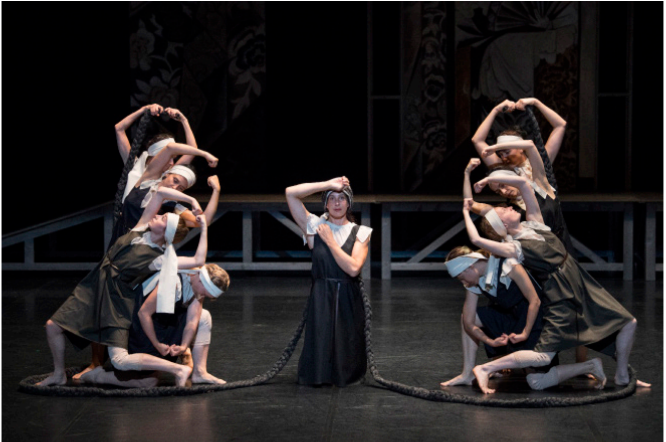
Les Noces