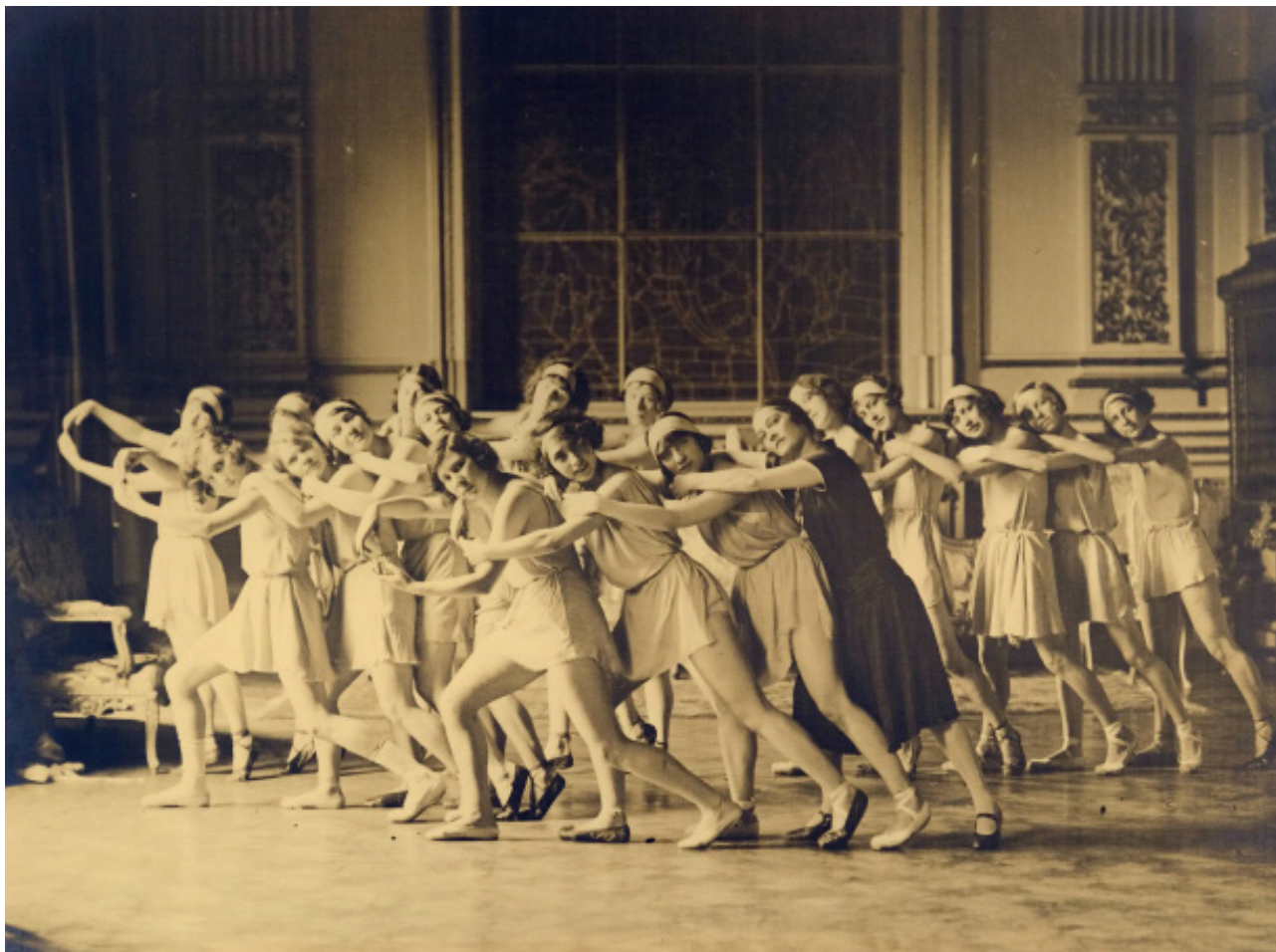
Répétition des Noces à Buenos Aires en 1926

Formée à l'École du Théâtre Marinski, à Saint-Pétersbourg en Russie, danseuse dans les œuvres de Michel Fokine et de Vaslav Nijinski avant la guerre de 1914, Bronislava Nijinska (1891-1972) devient chorégraphe au sein des Ballets russes de Serge Diaghilev entre 1921 et 1924, avant d'œuvrer pour d'autres compagnies. C'est dans le contexte des Ballets russes qu'elle crée Les Noces en 1923, après Renard et Le Mariage d'Aurore en 1922, et avant Le Train Bleu et Les Biches en 1924. Puis elle chorégraphiera Bolero pour la compagnie d'Ida Rubinstein en 1928.