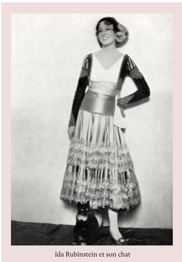
Ida Rubinstein et son chat